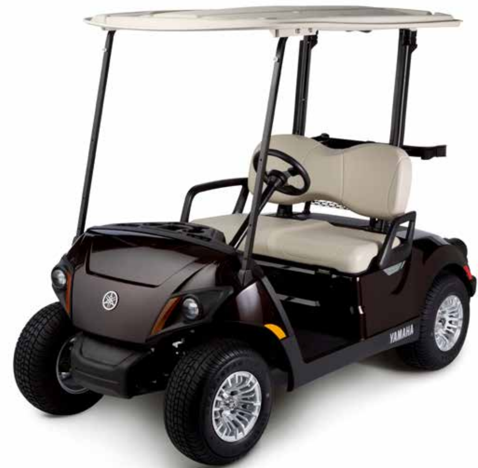
Ce modèle est présenté avec des accessoires en option